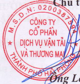
Ông Lê Tất Hưng